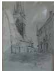
Wilhelm Danz Stadtansicht Kiedrich Bleistiftzeichnung, 1909