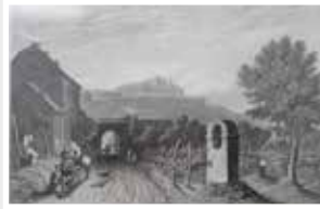
1840 - Schloss Johannisberg Rheingau Ansicht Geisenheim Stahlstich engraving