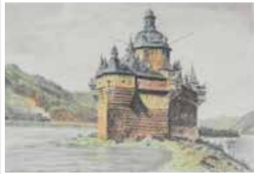
Burg Pfalzgrafenstein im Rhein bei Kaub, color. Litho-Aquarell