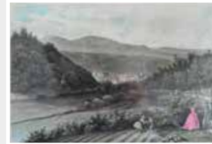
Eberbach Handkolorierter Stahlstich um 1850 Klimsch/Carl Meyers, Nürnberg