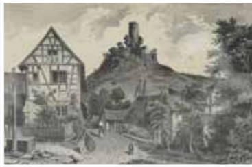
Stahlschneidung Burg Scharfenstein Kiedrich, Klimsch 1. Hälfte des 19. Jahrhunderts