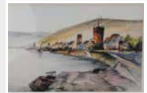
Rüdesheim am Rhein Kleines Aquarell