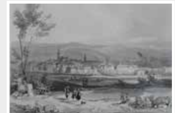
Wiesbaden Rhein Gesamtansicht seltener echter alter Stahlstich 1844