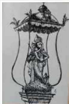
Tuschezeichnung „Madonna in Hochheim“ Kai Rohde 2020