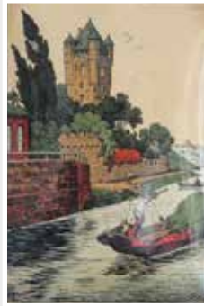
Eltviller Burg Jugendstil-Farblithographie 1900 (Leihgabe von Privat)