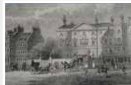
The Cambridge House Piccadilly 94, Stadthaus der Suttons in London 1854