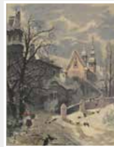
Grafik-Original Holzstich handkoloriert 1885 „Eberbach“