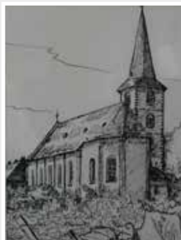
Federzeichnung „Peter und Paul Kirche in Hochheim“ Kai Rohde, 2020