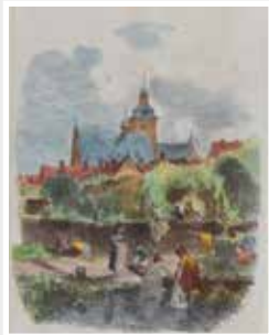
Parthie aus Winkel Rhg./Farb- holzschnitt.um 1880 sign.A.