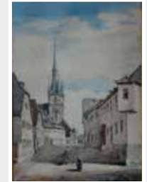
um 1810 Kronberger Malerkolonie (?)