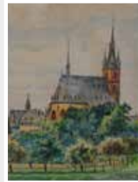
Aquarell, Blick auf St. Valentin Kiedrich vom Tal aus