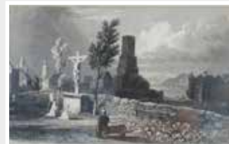
Rüdesheim Tombleson Stahlstich 1832