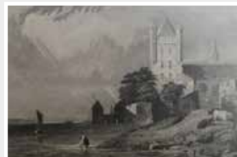
Eltville, Eldfeld, Original Stahlstich 1838