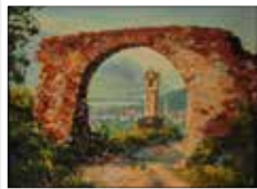
Kabinettgemälde „Blick aus dem Weinberg ins Tal“ ca. 1940