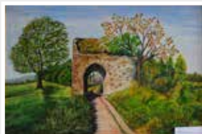
Mapper Schanze, Gemälde Mondani