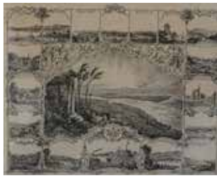
Der nassauische Rheingau, Lithographie um 1850