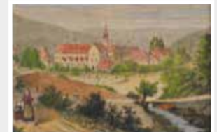
Kolorierter Holzstich Kloster Eberbach um 1870