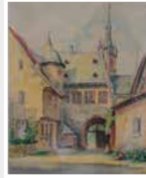
Hinterm Rathaus Kiedrich, Gemälde 1950er