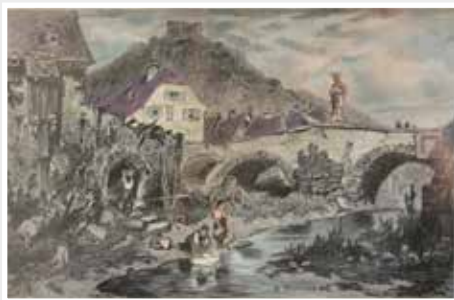
An der Wisper mit Ruine Nollich handkolorierter Holzstich um 1878/80, R. Püttner