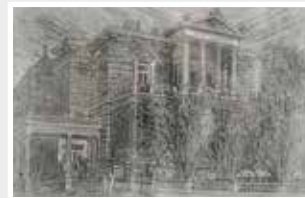
Villa Clementine Wiesbaden Robert Schanzenbacher Holzstich