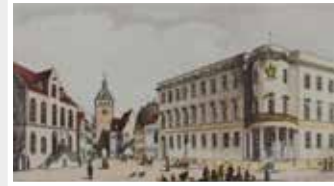
Alt Wiesbaden, Rathaus und Schloss, Radierung, Graphik