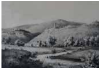
Kiedrich vom Bachtal aus, 19. Jh.