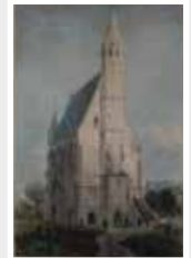
Kiedrich Michaelskapelle Kolorierter Stich um 1840