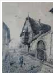
v. Stiernberg, um 1910 Binger- fortenstraße zur Alten Schmiede