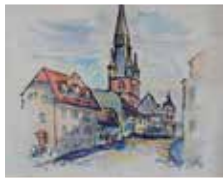
Blick auf die St. Valentinus Kiedrich, unleserlich signiert