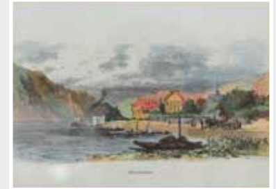
Rheinansicht mit Aßmannshausen, Farbholzschnitt, um 1880 sign. R.Pi(ü)ttner