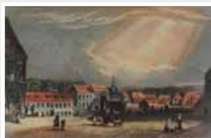
Bad Schwalbach, Originaler handkolorierter Stahlstich von ca. 1850

Sie möchten spenden? Der Förderkreis freut sich über jede Spende! Spendenkonto Wiesbadener Volksbank IBAN: DE56 5109 0000 0054 0280 08