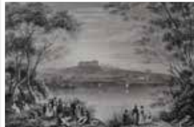
Schloß Johannisberg Metternich Rhein seltener echter alter Stahlstich 1844