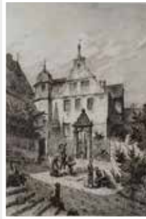
Rüdesheim, Teilansicht mit Figuren Staffage, Radierung V. B. Mannfeld, 1877