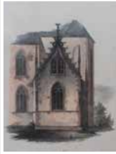
Kiedrich St. Valentin um 1850