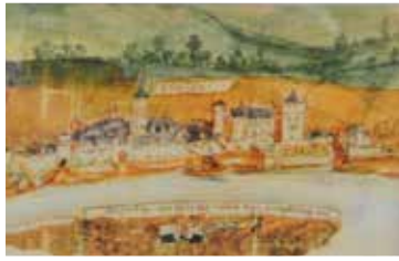
Eltville im Rheingau - Ulrich Pletzer Karte aus einem Reichs- kammergerichts- prozess zwischen Kurmainz und Kur- pfalz um den Besitz der Rheinauen