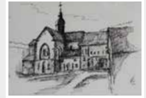
Kloster Eberbach, Fineliner-Zeichnung, Kai Rohde 2020