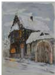
Alte Schmiede Kiedrich von 1985