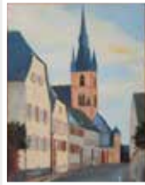
Erwin Talosi, Suttonstraße Blick auf die Valentinuskirche