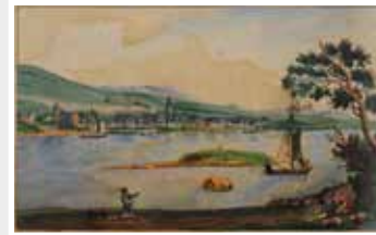
Rüdesheim vom linksrheinischen Ufer, Radierung 19. Jh.