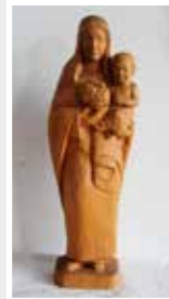
Anton Krams Skulptur Madonna