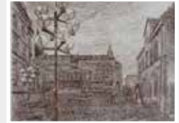
Schlossplatz Wiesbaden Robert Schanzenbacher Holzstich 1976