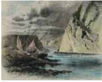
Loreley, kolorierte Ansicht Holzstich um 1878/80, R. Püttner