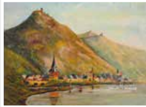
Zwei Ölgemälde Rhein: Burg Gutenfels, Burg Sterzig, Burg Liebenstein, JW Nieuwenburg um 1920