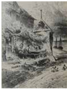
Walluf Boatman's Call 1903 old antique vintage print picture