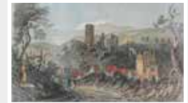
Burg Sonnenberg, Wiesbaden 1832 Tombleson Stich col.