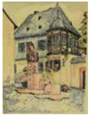
Erwin Talosi, Valentinsbrunnen kolorierter Druck von 1981, signiert