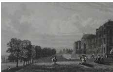
Wiesbaden Schloß Biebrich Rhein Hessen echter alter Stahlstich 1844