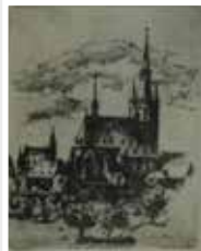
Drei Stahlschneidungen, klein, Kiedrich