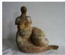
Erwin Talosi, Skulptur