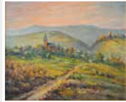
Walter Helmrich, Blick auf Kiedrich