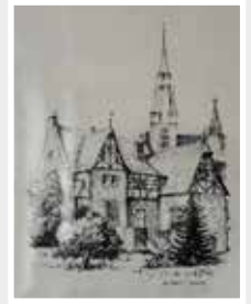
Oskar Wiffler, Kiedrich Blick auf die Kirche