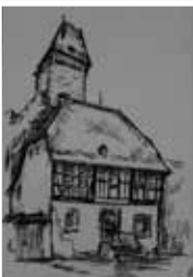
Tuschezeichnung „Burg Frauen- stein, Wiesbaden“ 2020, Kai Rohde