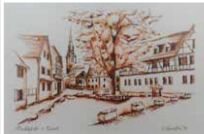
Erbach Rheingau Ev. Johanneskirche und Kath. Kirche