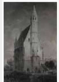
Kapelle Kiedrich Stich Rohbock um 1846