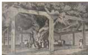
Frauenstein Am Lindenbrunnen Original Stich um 1870