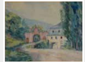
Aquarell Kloster Eberbach