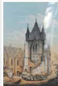
Kirche in Kiedrich im Rheingau fein koloriert 19. Jh.