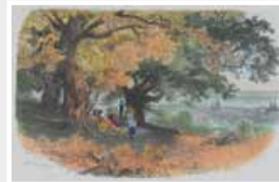
Gezigt op Wiesbaden van den Neroberg Orig. kolorierter Holzstich, R. Püttner (Leihgabe von Privat)