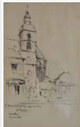
Hautvillers „Signe H. Bouvrie Dessin à la mine de plomb“, 1960